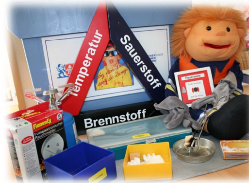
Material für Experimente

Laut einer Umfrage Rostocker Intensivmediziner ist jedem fünften Schüler keine Notrufnummer bekannt. Dies ist das Ergebnis einer Befragung von mehr als 10.000 Schülern der Klassen 5 bis 13 in sämtlichen Bundesländern und aller Schultypen.